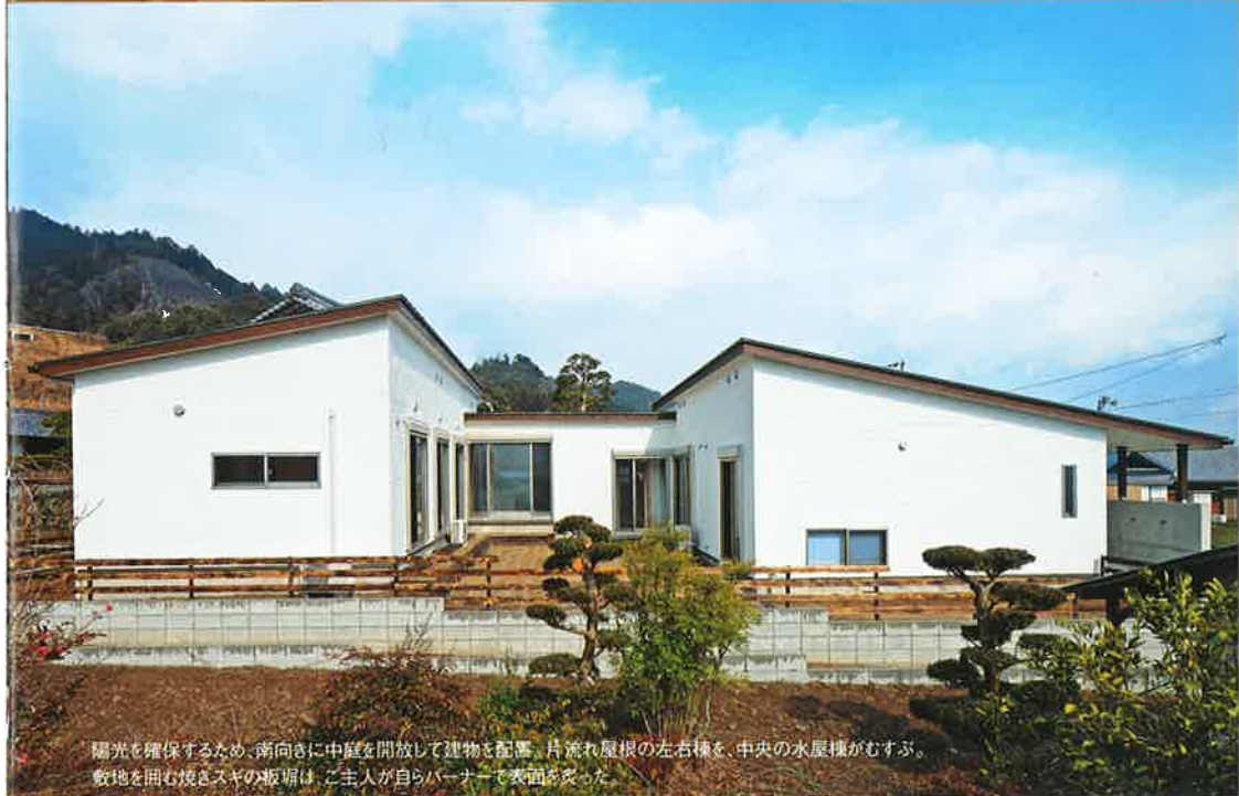
陽光も確保するため、南向きに中庭を開放して建物も配置。片流れ屋根の左右棟を、中央の水屋棟がむすぶ。敷地を囲む焼きスギの板塀は、ご主人が自らバーナーで表面を炙った。