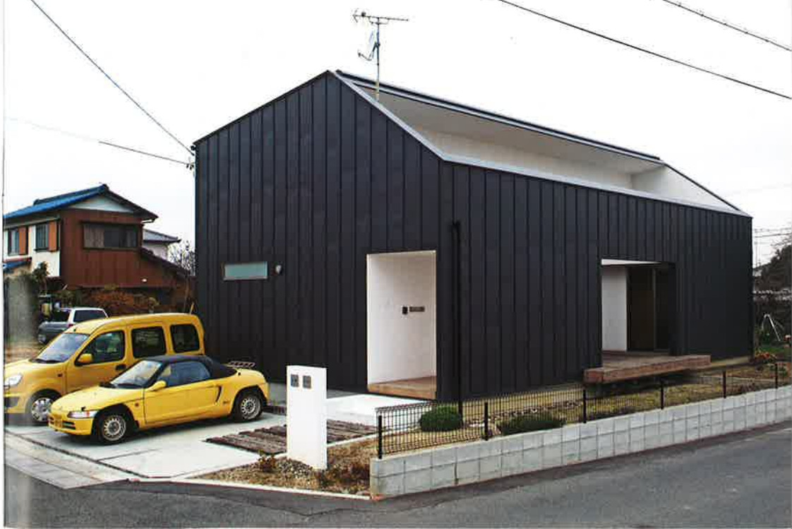
通りかかる人が皆、屋根はどうなっているのかと不思議がる、シンプルかつ特徴的な外観。