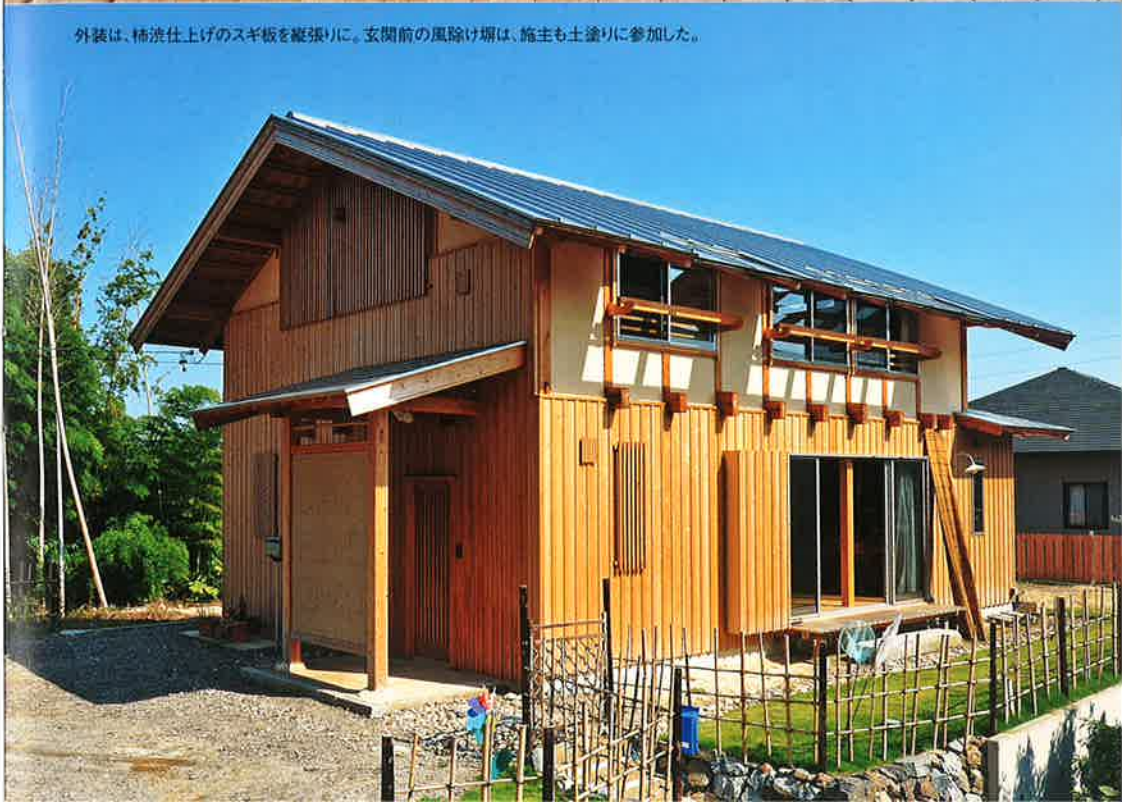
外装は、橋渡仕上げのスギ板を縦張りに。玄関前の風除け塀は、施主も土塗りに参加した。