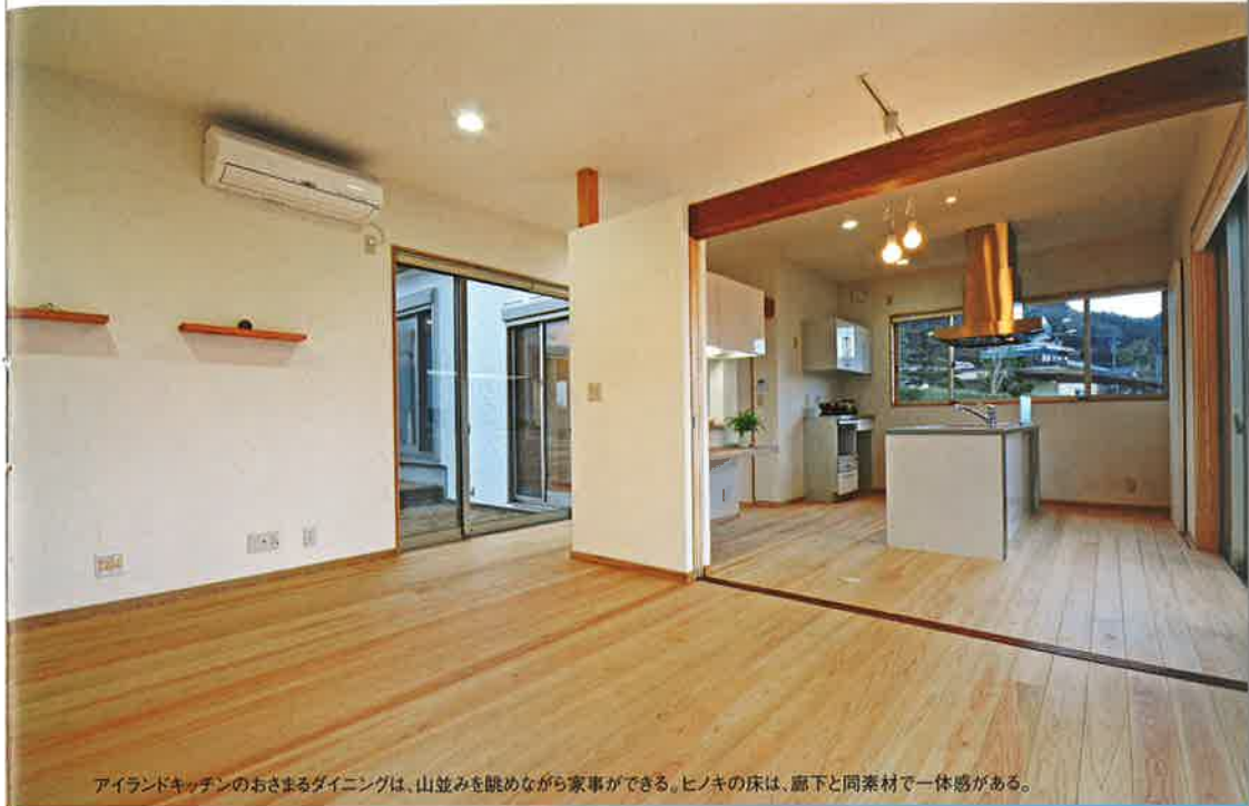
アイランドキッチンのおさまるダイニングは、山並みを眺めながら家事ができる。ヒノキの床は、廊下と同素材で一体感がある。