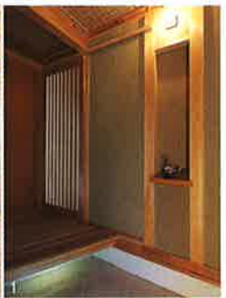
1. たたき土間と土壁の玄関。天井には簾を張って涼やかさを演出。 2. 小屋裏を現にした子ども室も、ヒノキ柱とスギ板張り。 3. 吹き抜けで開放感たっぷりのリビング・ダイニング。スギ、ヒノキのやわらかな色合いに、艶めくケヤキ柱が存在感を主張する。 ●(有)高橋建築工房 TEL.059・252・8808 http://www.takahashi-kk.net/ ●建築坪単価 約60万円