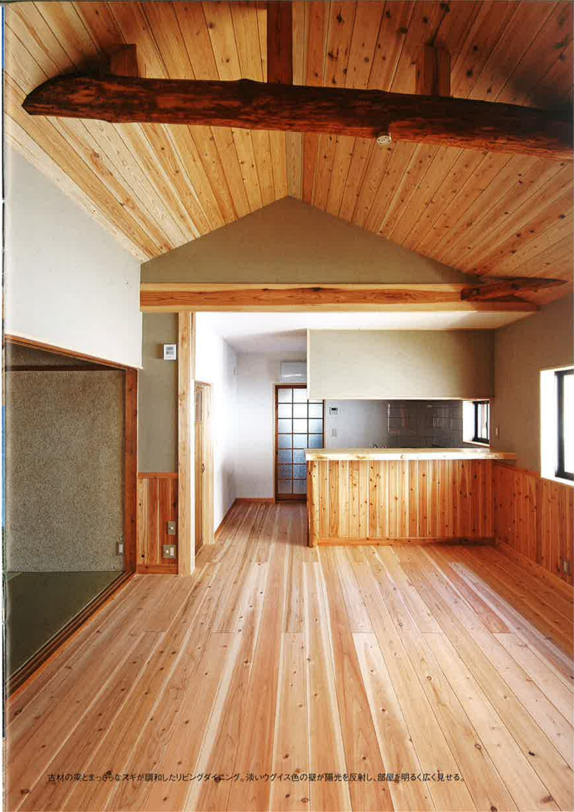
古材の梁とまっさらなスギが調和したリビングダイニング。淡いウグイス色の壁が陽光を反射し、部屋を明るく広く見せる。

●(有)克工務店 津市新東町塔世130 TEL.059-228-0773 http://www.katsu-koumuten.co.jp