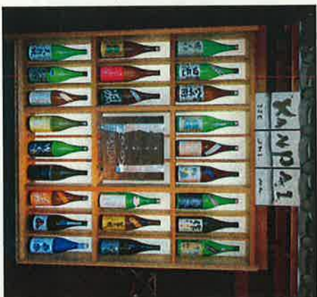
県産材を使用した看板

店の看板や商品の陳列棚など、目に触れやすい場所に三重県産材を使用し、木材の居心地の良い空間をつくり、店舗を訪れたお客様に三重県産材の魅力をPRいたします。